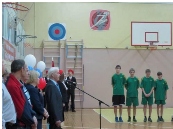
Турнир по баскетболу

В рамках военно-патриотического месячника в нашей школе прошло много мероприятий: посещение музея (школы №1, №3), Зала Боевой славы (школа №4), возложение цветов к Обелиску Славы, встреча с ветеранами, Смотр строя и песни, конкурс чтецов, литературно-музыкальная композиция, фестиваль солдатской песни и др. О некоторых из них мы вам расскажем.