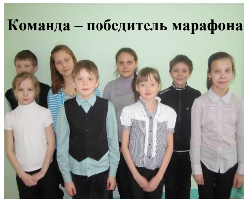
Команда – победитель марафона