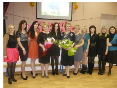
Педагоги с выпускницами 2003 г.