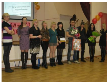
Выпуск 2003 года

Каждый из выпусков поздравлял учителей и дарил им цветы. Ветераны обнимали тех, кто вручал им в морозный январский вечер яркие букеты, узнавая бывших учеников, хотя многие из них очень изменились. А как тепло и сердечно взрослые выпускники рассказывали про свои «школьные года чудесные!» Запомнилось выступление ребят 2008 года выпуска. Их видеоклип с фотографиями о жизни класса – своеобразное признание в любви школе и учителям. Очень трогательно выглядели представители выпуска 1993 года: всего четыре человека - две милые пары. Как оказалось, двое из них - семейная пара (кстати, их сын в этом году тоже заканчивает нашу школу), а ещё одна пара – брат и сестра (дочь этой обаятельной женщины – наша десятиклассница).