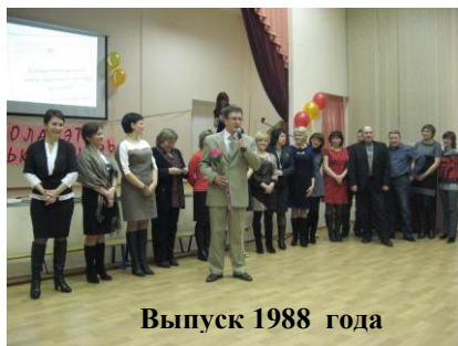
Выпуск 1988 года

25 января в нашей школе прошел вечер встречи выпускников. Вечер, когда бывшие ученики приезжают из разных городов, чтобы вновь, через много лет, встретиться со своими одноклассниками, узнать, кто как устроился в жизни, каких успехов достиг, поделиться с ними чувствами, которые их переполняют и, конечно,